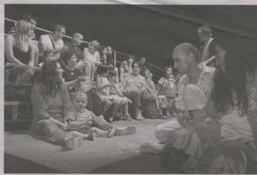
Niños acompañados por su padres en la representación de «En el jardín». (ARZUMENDU)